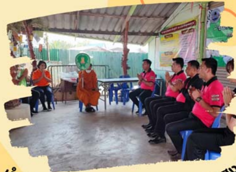
นำเงินที่ได้ร่วมกันถวายแก่พระภิกษุสงฆ์