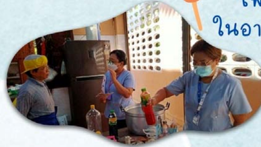
✔️ แม่ครัว-พ่อครัวโรงอาหาร