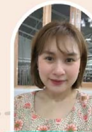
พลอยพลอย