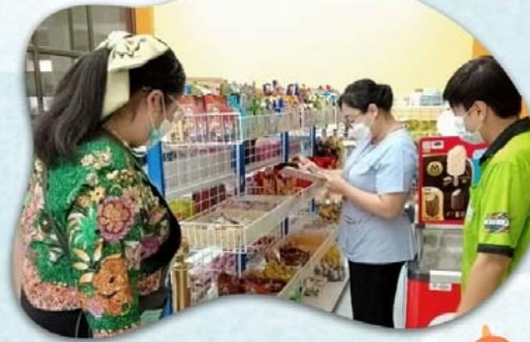
✔️ ครูอนามัยโรงเรียน

นำทีมงานคุ้มครองผู้บริโภค ลงพื้นที่แนะนำ ให้ความรู้ในการเลือกซื้อ การปรุง การเก็บอาหาร และสุ่มตรวจฉลากสินค้า ที่นำมาใช้ปรุงหรือจำหน่าย เพื่อสร้างความปลอดภัย ในอาหารให้กับน้องๆนักเรียน