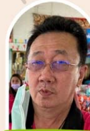
หมอทัศน์