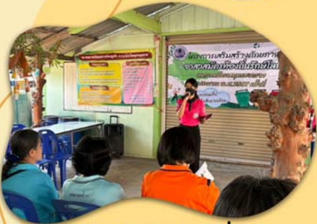
นั่งอยู่ให้ความรู้เรื่อง "การจัดทำถังขยะเปียกรักษ์โลกร้อน อย่างถูกวิธี"