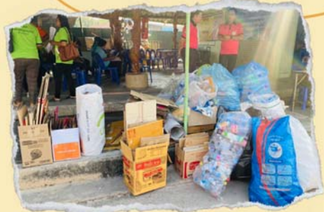
ขยะที่รวบรวมจากชุมชนเพื่อนำมาขาย