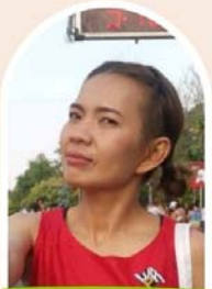
หมอแหม่ม