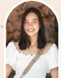
ไหม (ของแถม)